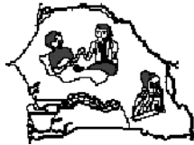
Réseau Sénégalais de Recherche sur le Sida